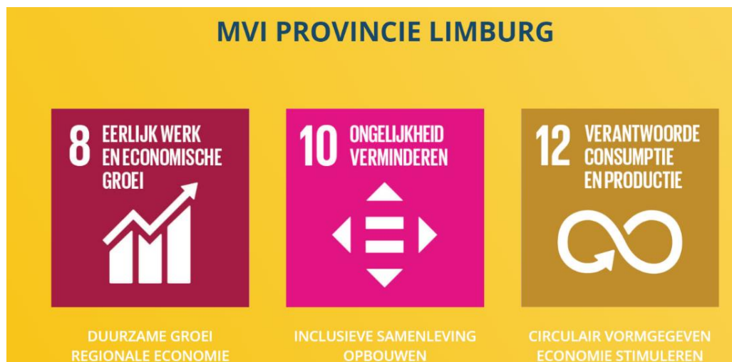
Figuur 1: speerpunten Maatschappelijk Verantwoord Inkopen

De provincie stelt zich als doel om zoveel mogelijk maatschappelijk verantwoord in te kopen op een professionele, integere, betrouwbare, transparante en uniforme wijze. Binnen MVI zijn 3 speerpunten gekozen voor periode 2020-2023.